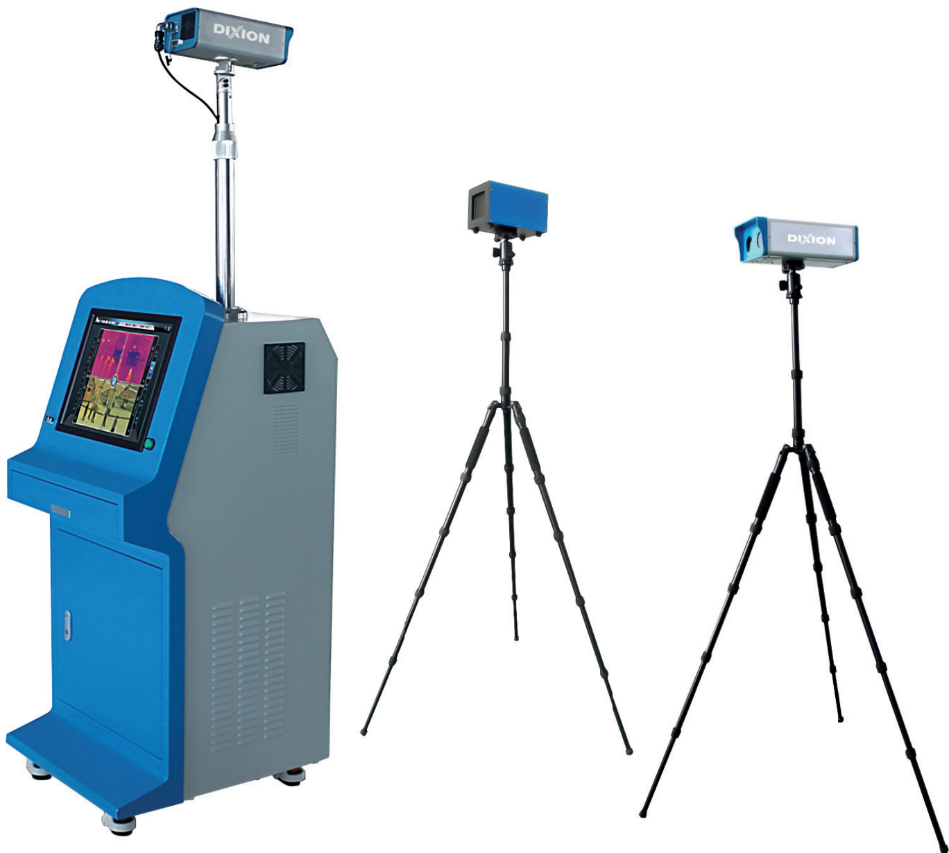
Dixon HY-2005B Dixon HY-2005B/E